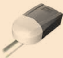
MOTOR DANK N